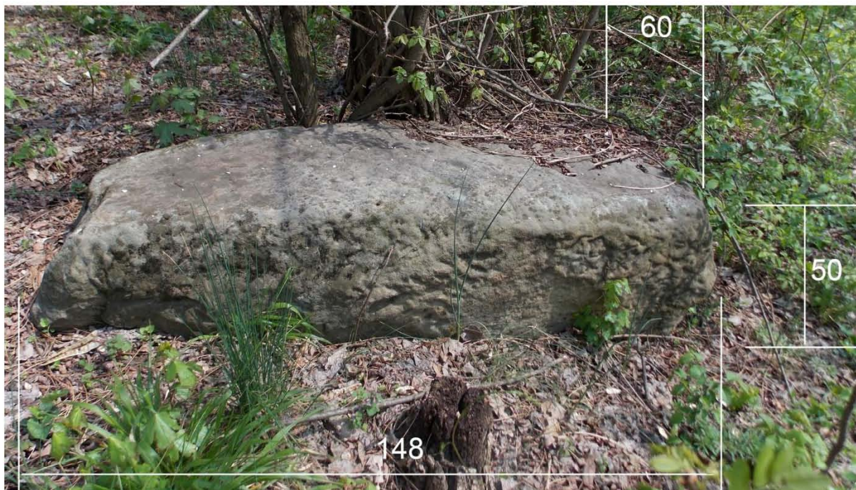
Сл.4. Димензије споменика

Споменик лежи на страни, у смјеру исток-запад, висине је 148 цм, ширине предње стране око 50 цм, а бочне око 60 цм са врхом који се завршава „на сљеме“. Такође и задњи дио споменика је „на сљеме,, а види се и граница (по обради) до које је дубине био у земљи.