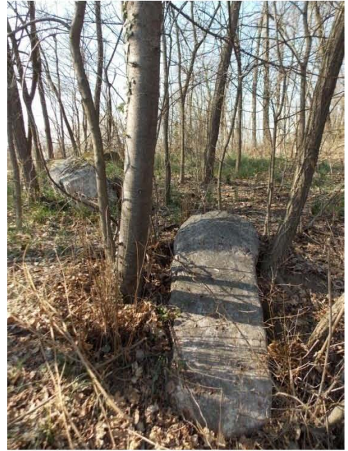
Сл.6. Споменик – тренутна стање