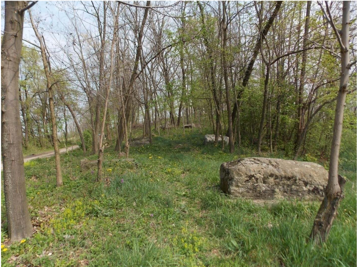
Сл.1. Поглед на некрополу са јужне стране

Средњовјековна некропола у Шакотићима је једна од познатијих некропола на Мајевици, али није детаљно археолошки истражена. О њој су многи истраживачи писали, па данас знамо да некрополу чини око 15ак надгробних споменика, углавном сљемењака, саркофага и неколико оборених стубова постављених у смијеру исток-запад .