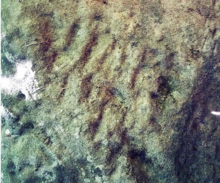
Сл.8. Доњи дио споменика – остаци украса