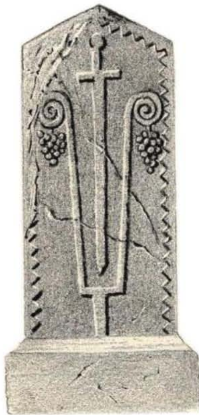
Сл.5. Цртеж украшеног споменика из ГЗМ

Обиласком некрополе у Шакотићима, упоређујући Трухелкин 4 цртеж из Гласника Земљаског музеја, на јужној страни некрополе, 20-так метара од споменика са новопронађеним натписом лоциран је дуго тражени споменик.