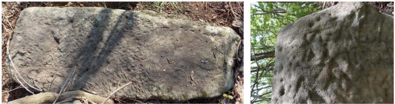
Сл. 2 и 3. Видљиви трагови обраде и тачкасти начин урезивања слова

Споменик је био прекривен је маховином, лишћем и грањем. Током пажљивог чишћења, по цијелом споменику се откривао начин обраде споменика – тачкасти ударци длијета којим је средњовјековни мајстор, негдје на неком каменолому, од обичне камене громаде обликовао овај споменик – биљег.