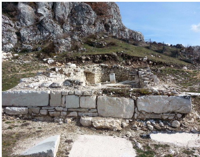
Слика 1: Остаци откопане цркве под Маковим Валом у Церници