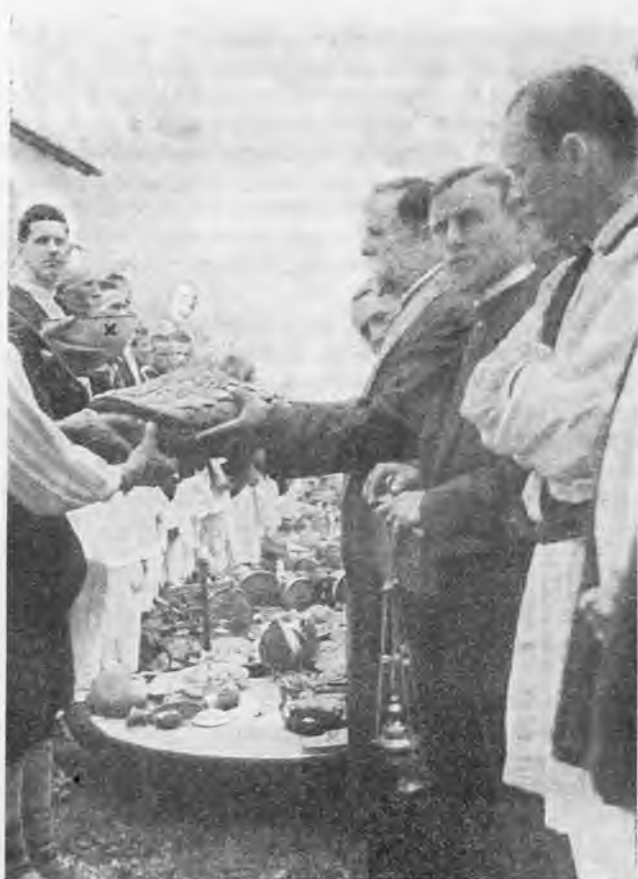
5. Ломљење крсног колача

Што наши оцви духовни наша чеда кршћавали Боже дај да буде совршено и кршћено ко св. Јована на ријечи Јордану; што наша чеда вјенчавали Боже дај да буде вјенчано и совршено ко у цара Константина и царице Јелене; што наше усопше душе у црну земљу сахрањивали Боже дај усопшијем душама рај и царство небеско те им се душа раја