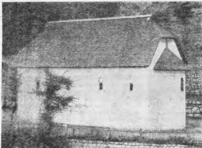
1. Црква Ловница

Заједничко слављење „Цркве Ловнице“ и околних кршњака-Ђурђевшћака. — За онога који описује народни живот и обичаје области Бирча, нарочиту пажњу свраћа заједничко слављење Ђурђев-дана „Цркве Ловнице“, коме је она посвећена, и околних кршњака-Ђурђевшћака, јер таквог слављења нема нигде на простору слављења крсног имена. Да се то види и што верније опише, требало је отићи о једном Ђурђев-дану, пратити ово слављење и снимити га. Пошто сам и сам кршњак-Ђурђевшћак, г. 1931 о слави син ме замењивао, а ја сам кренуо у Бирач „Цркви Ловнице“ да видим то јединствено заједничко слављење.