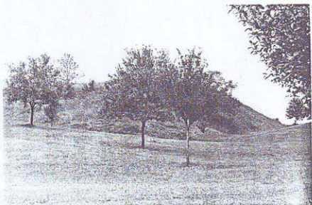
HUMKA NA LOK. "ČITLUCI ILI RAVAN", U ZASEOKU MEDIĆI, S. HUMCI