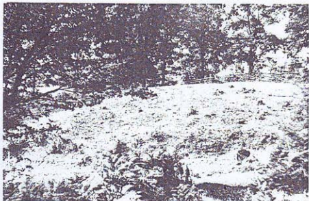
DANAŠNJI IZGLED LOKALITETA "MAĐARSKO GROBLJE", S. LUKAVICA