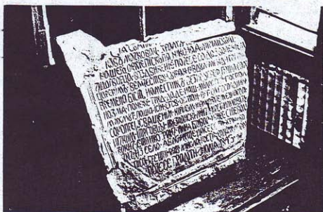
TABLA SA TEKSTOM O VREMENU PODIZANJA CRKVE