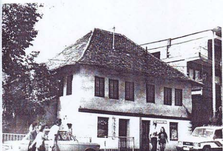
KUĆA ĐELIĆ MURATA, ČELIĆ