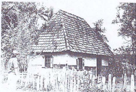
PUŠNICA NIKOLE STANIĆA, MRTVICA