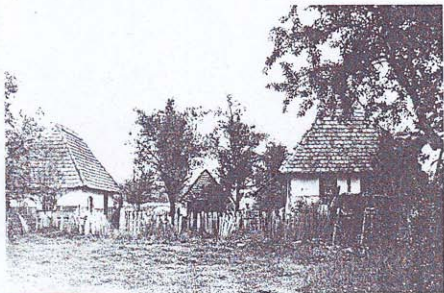
OKUČNICA NIKOLE STANIČA, MRTVICA