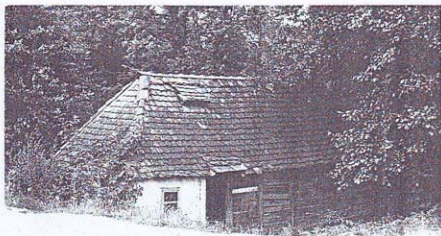
VODENICA MIČE MILOVANOVIĆA, PRIBOJ