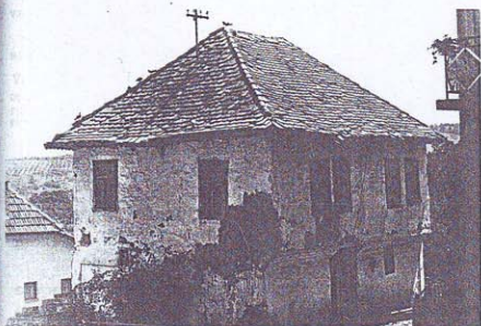
KUĆA IBRAHIMOVIĆ SADIQA, KORAJ