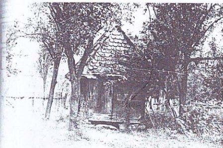
MLJEKARIĆ NIKOLE STANIĆA, MRTVICA